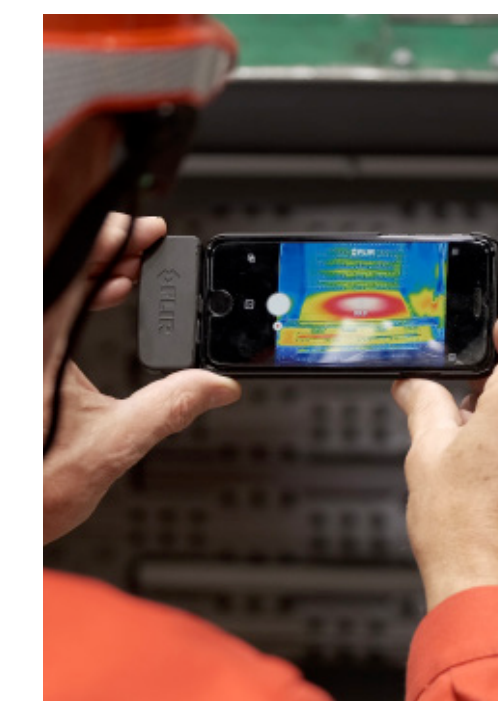
Visualización del punto de conflicto

N.º 1 Evaluar y manejar el costo total de granallado