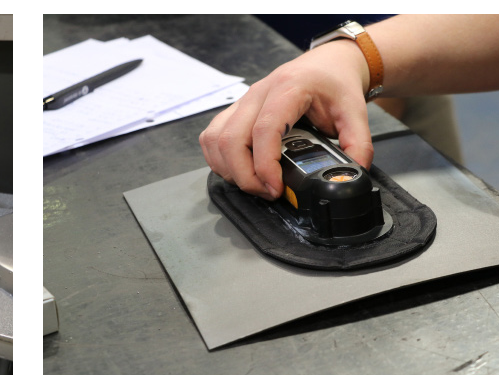
Evaluación de la limpieza técnico