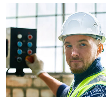
Mantenimiento y reparaciones