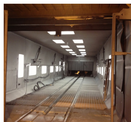
Actualizaciones en sala de compresores de aire

A través de nuestra división de servicios técnicos, ofrecemos una amplia gama de servicios para sus operaciones de granallado, que incluyen optimización de máquinas, formación in situ, reparaciones generales, actualizaciones y mantenimiento. Póngase en contacto con nuestro equipo altamente cualificado para que le asesoren sobre sus necesidades.