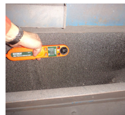
Optimización del lavado de aire