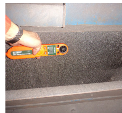
การเพิ่มประสิทธิภาพ Airwash