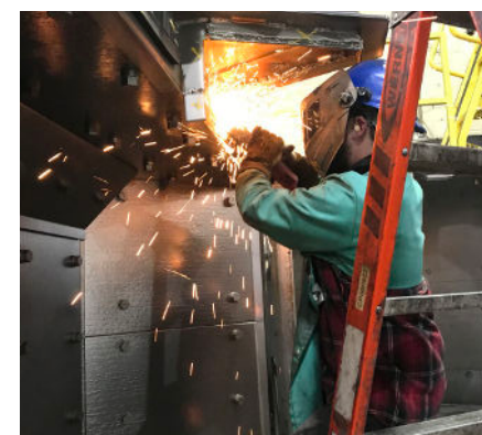
ปรับปรุงใหม่และยกเครื่อง เครื่องจักรพ่นและยิง