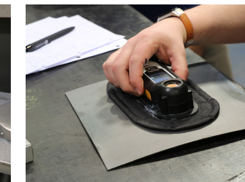
การประเมินความสะอาด