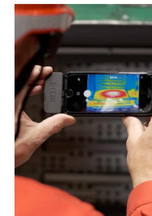
การแสดงผลสด